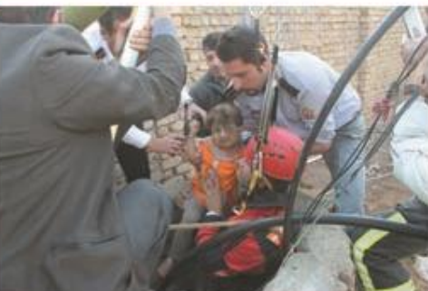
نجات کودک ۳ ساله از عمق چاه