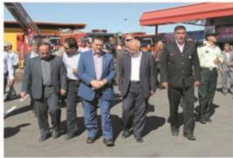
بازدید مسئولین از نمایشگاه ۷ مهر