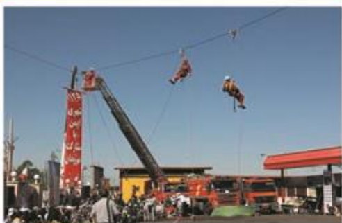
مانور کار در ارتفاع در روز آتش نشانی