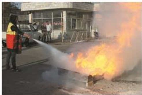
آموزش آتش نشانان داوطلب