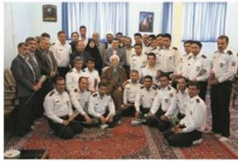
دیدار جمعی از آتش نشانان با امام جمعه قزوین