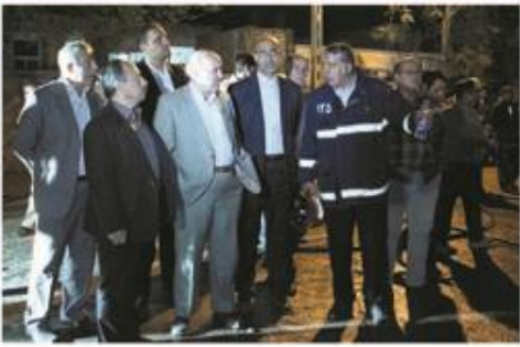
حضور استاندار و مدیران ارشد استان در عملیات اطفاء حریق